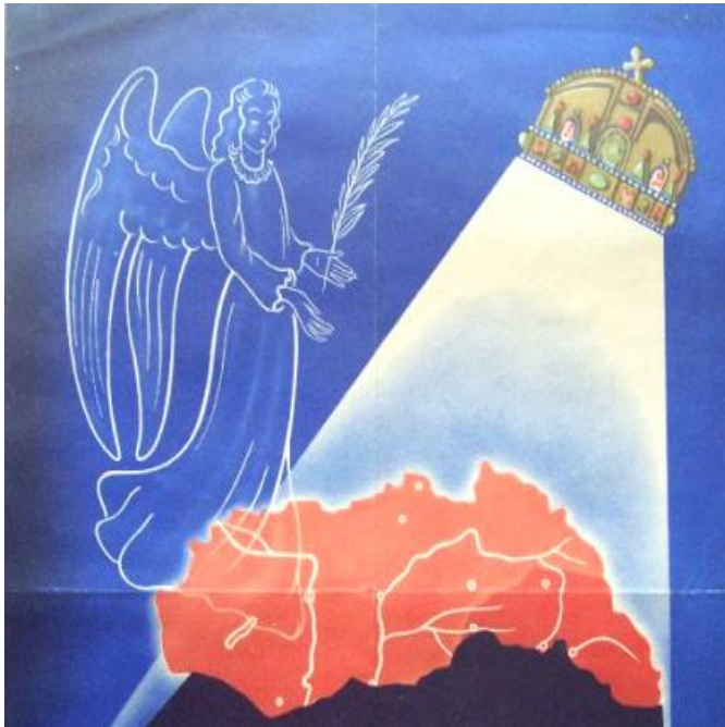
(Plakátrészlet, 1940 ősze)

„A németekkel kell mennünk, mert másképp nem lehetséges, de csak egy bizonyos pontig. Ez a pont, ez a határvonal a háborúban való részvétel. Ezt semmi esetre sem fogjuk megtenni, mert idegen érdekekért nem fogunk vérezni hiába. De borzalmas nehéz, talán lehetetlen ellenállni. A revízió, s ezt csak neked mondom, a legnagyobb veszély, amely fenyeget. [...] A revízióba bele fogunk pusztulni, ez fog minket a háborúba belesodorni. [...] ezzel örökre elköteleztük magunkat a németeknek, akik majd aztán követelik az árát. És ez az ár a velük való háborúzás lesz, az ország maga lesz az ára a revízióknak.” (Teleki Pál bizalmas beszélgetéséből, 1939. Idézi: Barcza György: Diplomataéveim 1911–1945 )